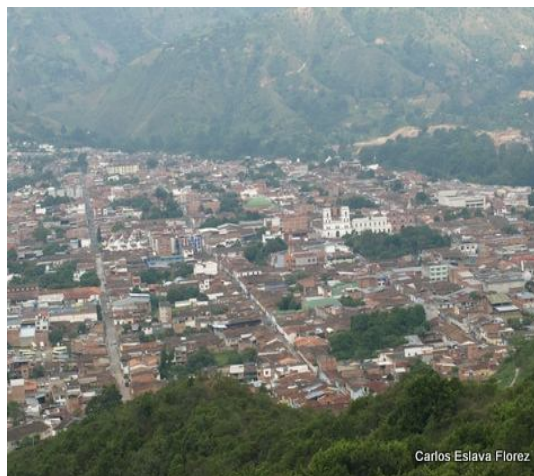
Carlos Eslava Florez

El municipio de Pie de Cuesta, mas tarde nombrado PIEDECUESTA y VILLA DE SAN CARLOS fue fundado el 26 de julio de 1774. Tiene una extensión de 344 kilómetros cuadrados, su altura sobre el nivel del mar es de 982 metros, presenta variedad en su relieve por lo cual tiene clima cálido,